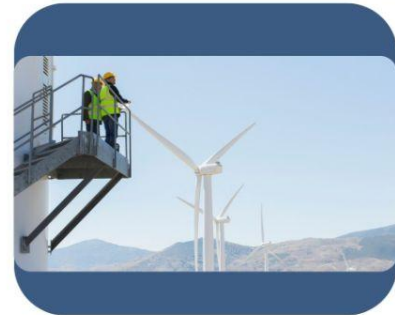
Recruiting Process Outsourcing (RPO)