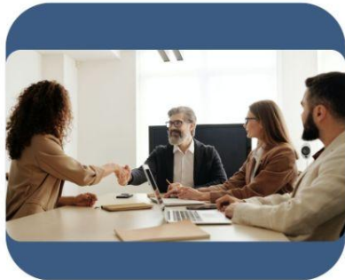
Selección de Directivos